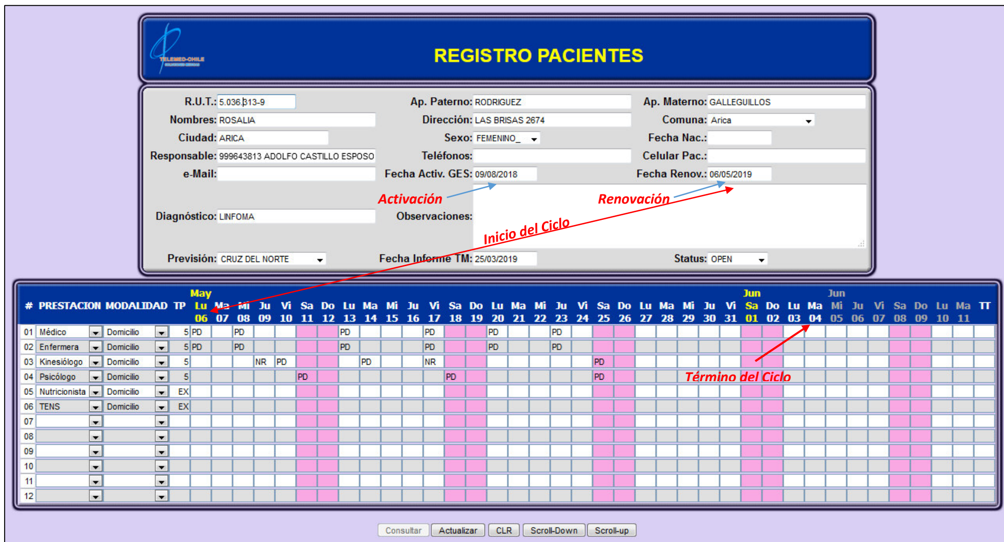
Fig.1 Registro Pacientes